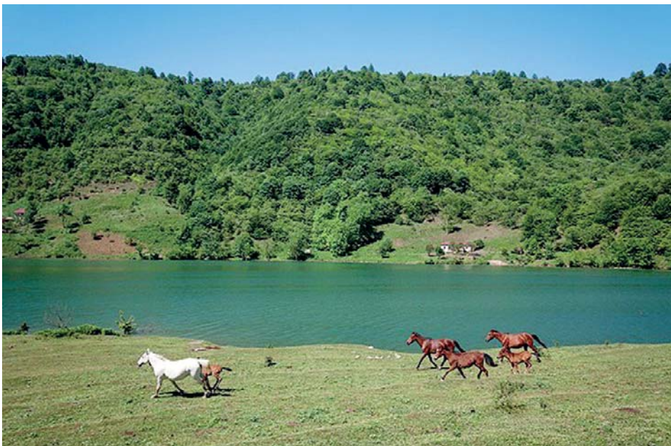
منطقه لهور سوادکوه