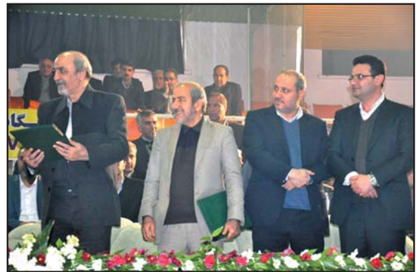
نخستین المپیاد کارگری کشور اسفند ماه امسال در مازندران برگزار شد

افتتاحیه اولین دوره المپیاد کارگری کشور به میزبانی استان مازندران با حضور وزاری تعاون، کار و رفاه اجتماعی و نیز ورزش و جوانان در سالن سیدرسول حسینی ساری برگزار شد. این مسابقات به مدت سه روز رقابت بامعرفی نفرات برتر به کار خود پایان خواهد داد. گفتنی است بیش از ۲۰۰۰ ورزشکاران در در ۱۲ شهرستان استان به رقابت پرداختند.