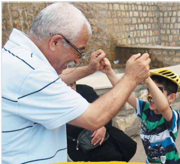
تابستان های مادر بزرگ ها و پدر بزرگ ها:

تابستان های گرم بسیاری از پی هم گذشت و تنها خاطرات شیرین و دلنشین روزها و شب های آن برای پدر بزرگها مادر بزرگهای ما باقی ماند. ما می توانیم باهم تابستان های پیش رو را به خاطراتی شاد برای نسل آینده و فرصتی با ارزش برای در کنار یکدیگر شاد بودن بدل کنیم. دست خودمان است. یک پرسش: اگر در سالهایی که می آید، زمانی که مادر بزرگ یا پدر بزرگ شدیم، خبرنگاری از ما همین سه سؤال را بپرسد، چه پاسخی به او خواهیم داد؟