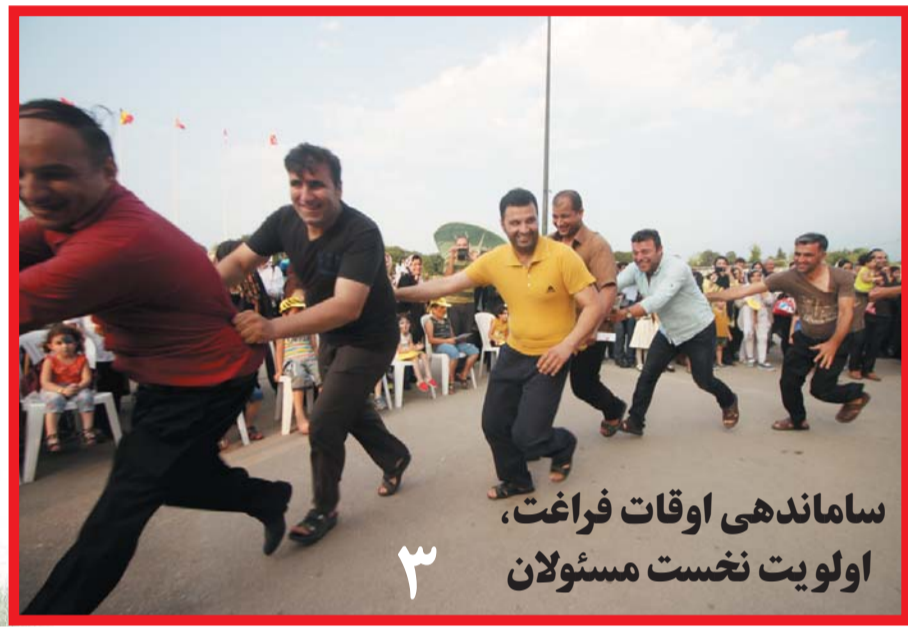
ساماندهی اوقات فراغت، اولویت نخست مسئولان