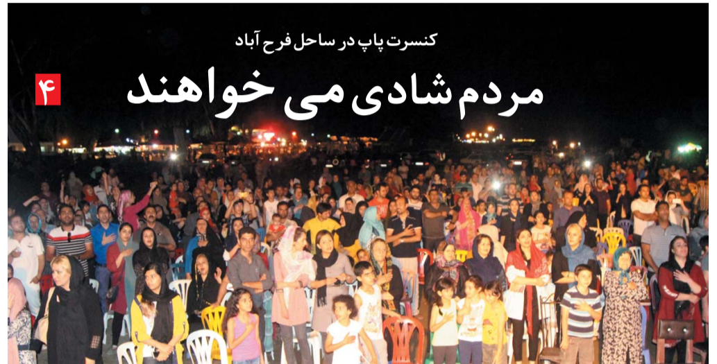
کنسرت پاپ در ساحل فرح آباد